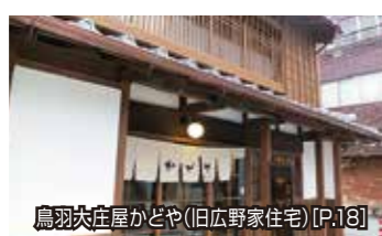
鳥羽大庄屋かどや(旧広野家住宅) [P.18]