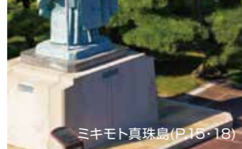
ミキモト真珠島(P.15・18)