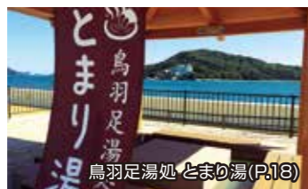
鳥羽足湯処 とまり湯(P.18)