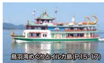
鳥羽湾めぐりとイルカ島(P.15・17)