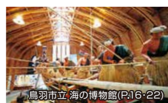
鳥羽市立 海の博物館(P.16・22)