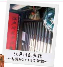
江戸川乱歩館 ～鳥羽みなとまち文学館～