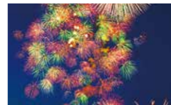
鳥羽みなとまつり(P.10)