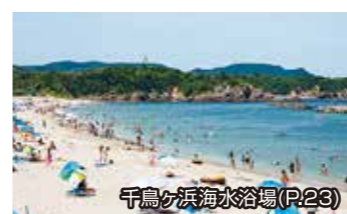
千鳥ヶ浜海水浴場(P.23)