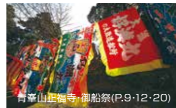
青峯山正福寺・御船祭(P.9・12・20)